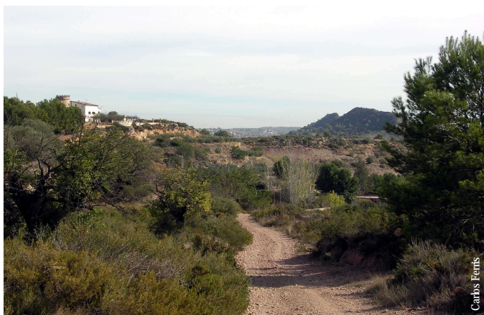
Camino rural a Monserrat